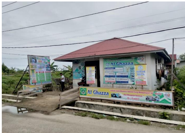
Gambar 3. Tampak Samping Lokasi Rumah Tahfidz Al Ghazza

Untuk kegiatan aktivitas rumah Tahfidz Al Ghazza diperlihatkan pada Gambar 4 s/d Gambar 9 berikut