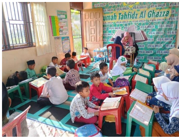
Gambar 6. Aktivitas Pembelajaran di Rumah Tahfidz Al Ghazza