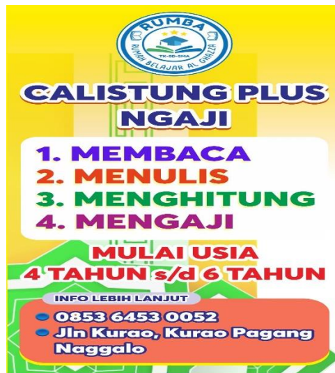
Gambar 11. Aktivitas Kegiatan di Rumah Tahfidz Al Ghazza