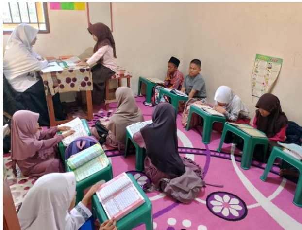
Gambar 8. Aktivitas Pembelajaran di Rumah Tahfidz Al Ghazza