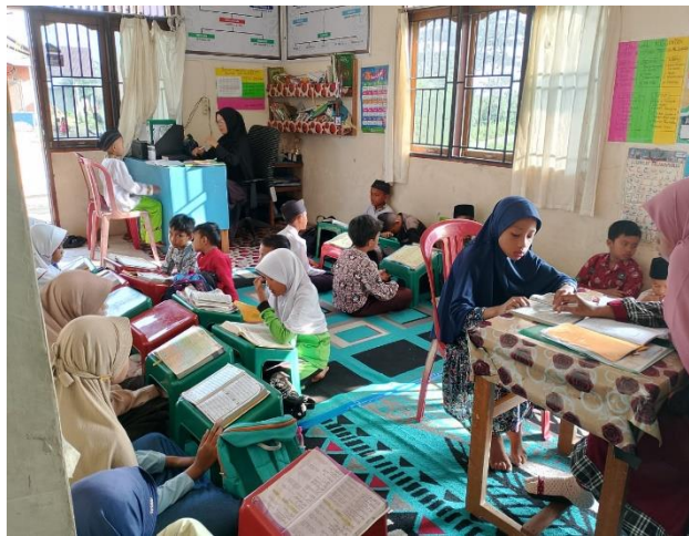
Gambar 5. Aktivitas Pembelajaran di Rumah Tahfidz Al Ghazza