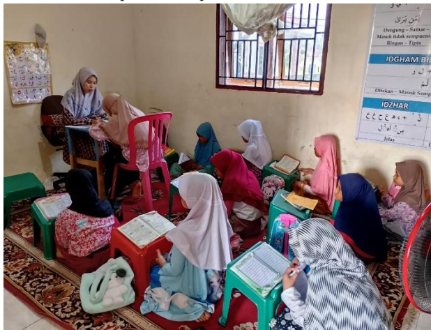
Gambar 4. Aktivitas Pembelajaran di Rumah Tahfidz Al Ghazza

Untuk kegiatan aktivitas rumah Tahfidz Al Ghazza diperlihatkan pada Gambar 4 s/d Gambar 9 berikut