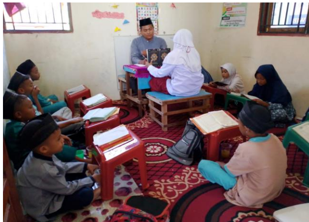
Gambar 9. Aktivitas Pembelajaran di Rumah Tahfidz Al Ghazza

Untuk informasi jenis – jenis kegiatan yang dilaksanakan rumah Tahfidz Al Ghazza diperlihatkan dengan brosur pada Gambar 10 s/d Gambar 11 berikut