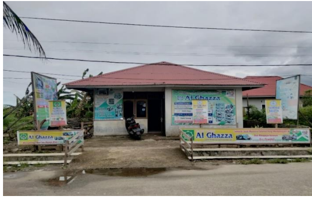
Gambar 2. Tampak Depan Lokasi Rumah Tahfidz Al Ghazza

Untuk bangunan tempat aktivitas rumah Tahfidz Al Ghazza diperlihatkan pada Gambar 2 s/d Gambar 3 berikut