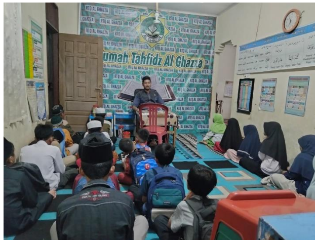
Gambar 7. Aktivitas Pembelajaran di Rumah Tahfidz Al Ghazza