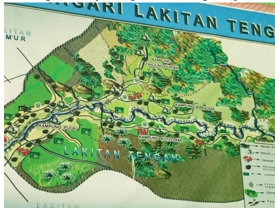
Gambar 2. Peta Nagari Lakitan Tengah

Nagari Lakitan Tengah berada di Kecamatan Lengayang, Kabupaten Pesisir Selatan, Provinsi Sumatra Barat. Luas Nagari: 55,36 kilometer persegi atau 9,37 persen dari luas wilayah Kecamatan Lengayang. Jarak dari Kantor Wali Nagari ke Ibukota Kecamatan adalah 13,00 kilometer, ke Painan 78,00 kilometer dan ke Kota Padang 148,00 kilometer. Nagari Lakitan Tengah terdiri dari empat kampung yaitu kampung, kampung koto lamo, kampung air kalam, dan kampung tanjung durian. Jumlah penduduk di nagari ini kurang lebih sebanyak 5.468 orang yang terdiri dari 1.579 kepala keluarga. Untuk peta nagari lakitan tengah dapat dilihat pada gambar 2.