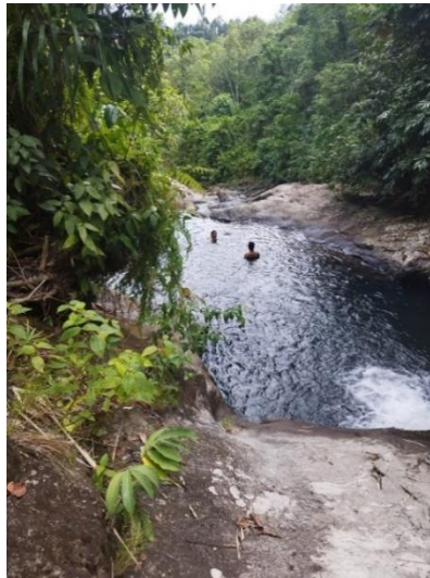
Gambar 3. Foto pengambilan data debit air.

Debit air adalah volume air yang mengalir melalui suatu saluran dalam satu satuan waktu. Salah satu metode yang umum digunakan untuk menentukan debit sungai adalah metode profil sungai [11,12], pada studi ini dilakukan dibagian sungai yang sisi pinggirannya hampir simetris, serta memiliki aliran yang dapat dilihat pada gambar 3 berikut.