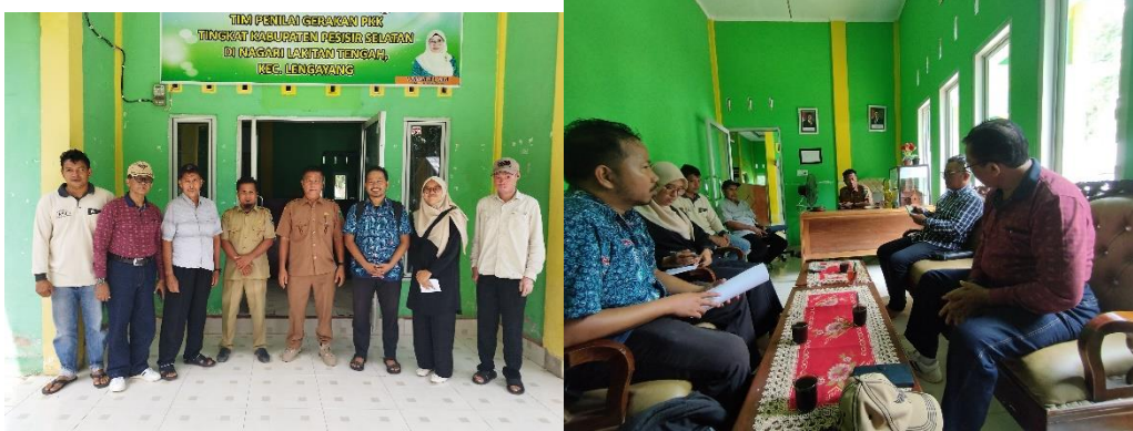
Gambar 4. Sosialisasi yang dilakukan di Kantor Wali Nagari Lakitan Tengah

Dampak sosial dan edukatif dari program pengabdian dan studi kelayakan PLTMH di Nagari Lakitan Tengah sangat signifikan bagi masyarakat setempat. Secara sosial, kegiatan ini meningkatkan kesadaran dan kemandirian masyarakat dalam mengelola sumber daya alam lokal untuk memenuhi kebutuhan energi secara berkelanjutan. Masyarakat diajak terlibat langsung melalui sosialisasi, diskusi, dan pembentukan Kelompok Swadaya Masyarakat (KSM), yang memperkuat rasa memiliki dan tanggung jawab terhadap pengelolaan PLTMH. Selain itu, ketersediaan energi listrik berpotensi mendorong pertumbuhan ekonomi desa, membuka peluang usaha baru, serta meningkatkan kualitas hidup, khususnya dalam bidang pendidikan, kesehatan, dan produktivitas rumah tangga. Dari sisi edukatif, kegiatan ini memperluas pemahaman masyarakat tentang prinsip kerja PLTMH, regulasi energi terbarukan, serta aspek teknis dan ekonominya. Program ini juga berfungsi sebagai sarana transfer ilmu pengetahuan dan teknologi antara akademisi dan masyarakat, membangun kapasitas lokal dalam pengoperasian serta pemeliharaan sistem energi terbarukan. Dengan demikian, proyek ini tidak hanya memberikan manfaat teknis dan ekonomi, tetapi juga membentuk masyarakat yang lebih sadar energi, mandiri, dan berwawasan lingkungan.